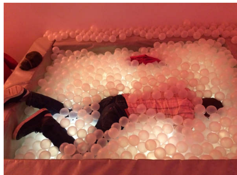
Nej, det var ikke et dykker kursus....