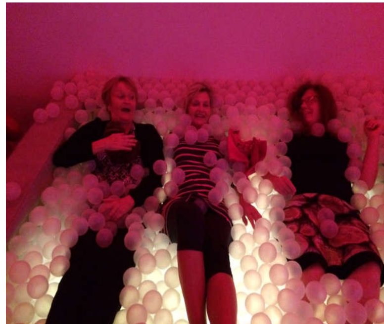
Personalet har været på kursus....